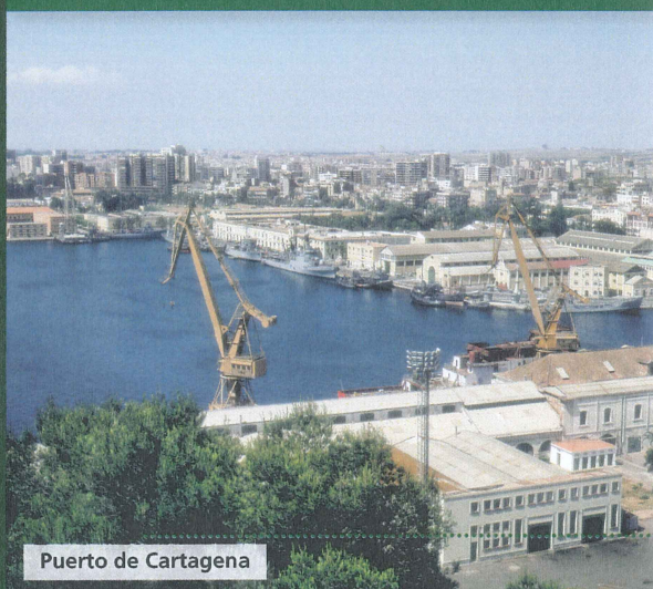
Puerto de Cartagena